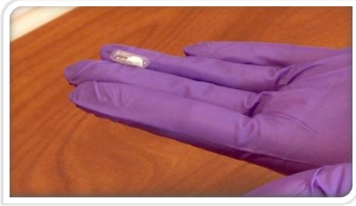
Supositorio (sintético) de prostaglandina

Medicamentos: Se puede insertar un supositorio de una hormona sintética para ayudar a adelgazar y abrir (borramiento y dilatación) el cuello uterino. Algunos medicamentos (prostaglandinas) se pueden dar por vía oral o vaginal. El Misoprostol es un medicamento utilizado comúnmente para la inducción. Se puede usar un goteo de oxitocina (Pitocin) intravenosa para estimular las contracciones uterinas.